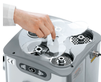
Vano per piastre e coltelli